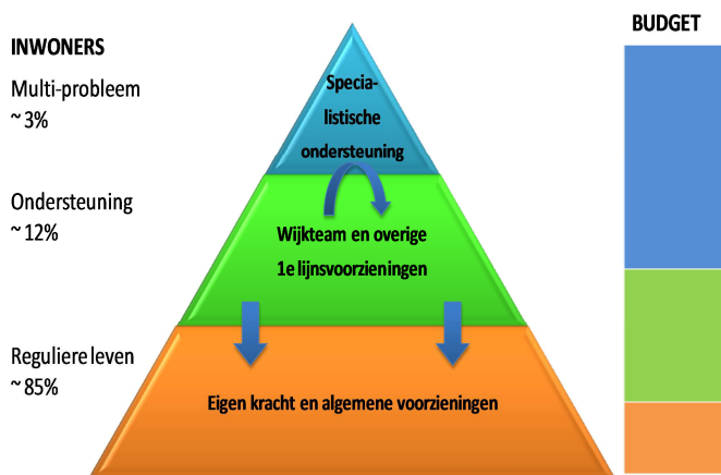
Figuur 1: Bron Eindrapport VISD

In de Verkenning Informatievoorziening Sociaal Domein uitgevoerd door KING, in opdracht van het Rijk en de VNG is bovenstaande praktijk verbeeld in onderstaande piramide.