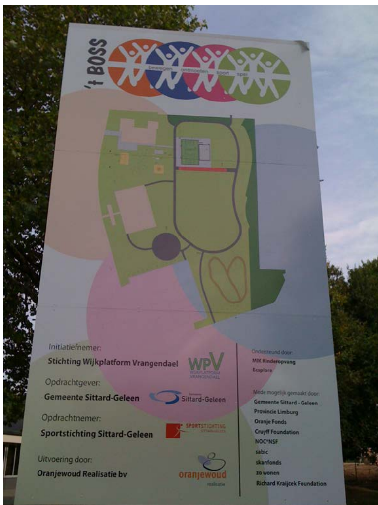
Figuur 1.8 Het plan voor het BOSS park.

Na de projectperiode (2010-2013) dient de organisatie ingebed te worden in een bewonersorganisatie die het beheer, het onderhoud en de exploitatie van het park gaat uitvoeren. Daartoe is de stichting het BOSS park in december 2013 opgericht. De projectperiode is echter nog met vier jaar verlengd en in 2014 is de statusquo gehandhaafd, wat betekent dat de sportstichting nog het beheer en onderhoud uitvoert. Doorontwikkeling naar een bewonersbedrijf heeft aan het einde van de onderzoeksperiode nog niet plaatsgevonden.