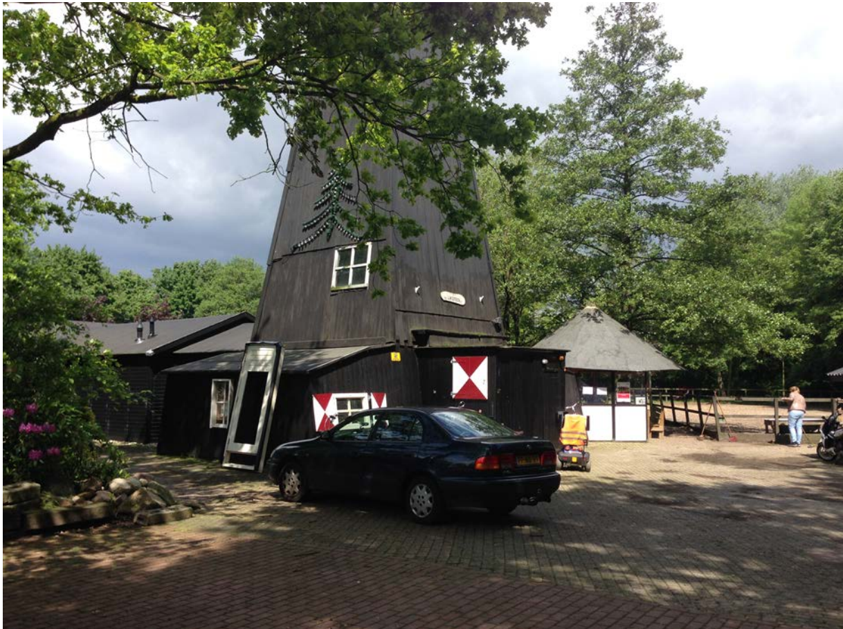
Figuur 1.5 't Geerdink

De directe aanleiding om een bewonersbedrijf op te richten zijn de bezuinigingen van gemeente, en in het bijzonder de bezuiniging op begeleidingskosten van werkervaringsplaatsen, waardoor eind 2012 de op dat moment grootste inkomstenbron voor de stichting wegvalt. Daardoor konden twee personeelsleden niet langer worden aangehouden. Door de verminderde beschikbaarheid van mensen voor werkervaringstrajecten kan de stichting ook minder opdrachten uitvoeren voor de gemeente en de woningcorporatie. De stichting verkeert daardoor inmiddels in financiële problemen.