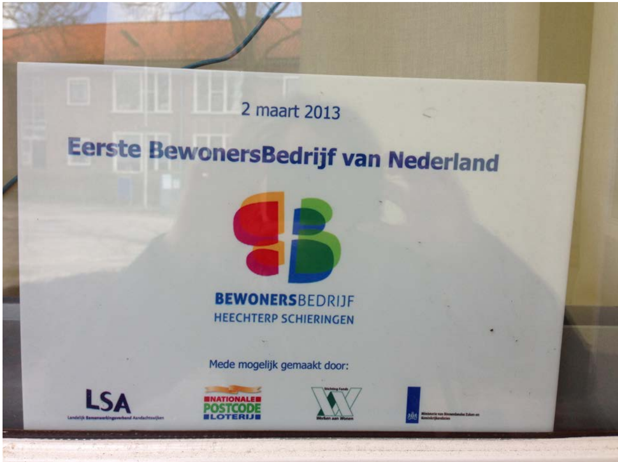
Figuur 7.3 Het kantoor van BBHS, eerste bewonersbedrijf van Nederland

Na moeizame onderhandelingen en een periode waarin de oplossing verder weg leek dan ooit, heeft het BBHS een opdracht gekregen van de woningcorporatie Elkien om 18 portieken in haar woningbezit schoon te houden. Op basis van het door Elkien verstrekte werkprogramma is een offerte opgesteld (en door Elkien geaccepteerd) waarin vier uur per week wordt schoongemaakt tegen een bedrag van €4000 per jaar. Het BBHS werkt met groepen van vier personen aan deze opdracht, dus maximaal 16 uur werk. Het betreft vrijwilligers, waarvan sommige met een bijstandsuitkering, die voor het werk een vrijwilligersvergoeding krijgen. De resterende inkomsten worden gebruikt als dekking voor de kosten van het bewonersbedrijf.