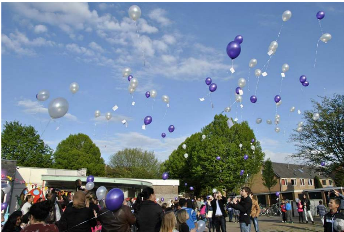
Figuur 1.1 Opening van De Witte Vlinder

De Gemeente (door het beschikbaar stellen van een gebouw), de provincie (subsidie van €170.000 voor fysieke aanpassingen van het gebouw, waaronder het dak), de Koninklijke Nederlandse Hei- demaatschappij (lening van €50.000), het Oranjefonds en GAMMA (voor het aanleggen van de vlin- dertuin). Er is geen startkapitaal van het LSA.