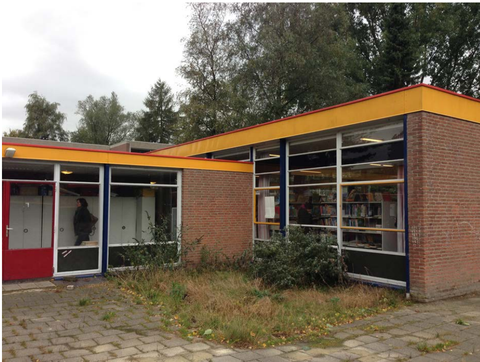
Figuur 7.1 De school in Oktober 2013

Net als in Amersfoort heeft het bewonersbedrijf een voormalig schoolgebouw van de gemeente overgenomen. Het grote verschil is dat de overname in Emmen ook gepaard gaat met een overdracht van eigendom naar het bewonersbedrijf. Daardoor is het bewonersbedrijf volledige verantwoordelijk voor het onderhoud en beheer van het gebouw en de kosten daarvan, inclusief de energielasten. Het gebouw is inmiddels opgeknapt, maar daarbij zijn hoge, deels onvoorziene, bouwkosten gemaakt en het in slechte staat verkerende dak is nog niet gerenoveerd. Dit noopt het bewonersbedrijf om snel geld te gaan verdienen. Tot het moment dat er geld verdiend kon worden, bestonden de inkomsten uit startkapitaal van het LSA (€135.000), subsidies van de Stichting Doen (€50.000), de woningcorporatie Lefier (€25.000) en de Rotary (€3.000). Deze middelen zijn vooral gebruikt voor de verbouw, aanschaf van materialen en een reserve voor de hoge energielasten.