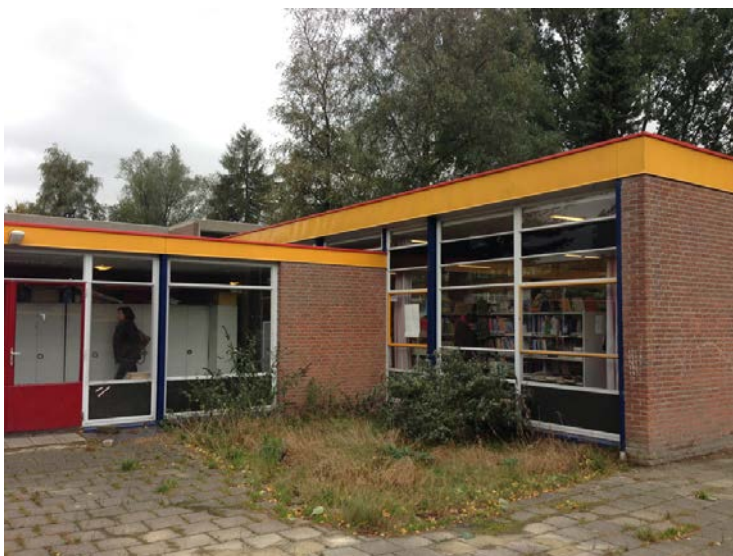
Figuur 1.4 De school in Oktober 2013