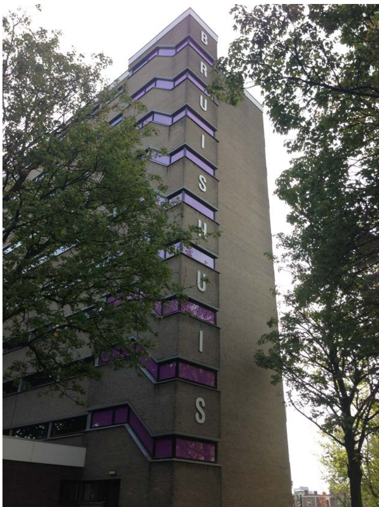
Figuur 1.2 Het Bruishuis, een opvallend gebouw in de wijk.