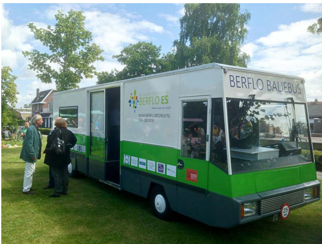
Figuur 7.2 De Berflo Baliebus

Berflo Baliebus is een SRV-wagen die is omgebouwd tot een mobiele ontmoetingsruimte en die op vaste dagen en tijdstippen door de wijk rijdt. In de Baliebus kunnen buurtbewoners terecht voor hulp, ondersteuning en informatie, maar ze kunnen zich ook melden als vrijwilliger voor enkele andere projecten (zie hieronder) van het bewonersbedrijf. Indien nodig worden bewoners met hun vraag of probleem doorverwezen naar deskundigen of instantie(s).