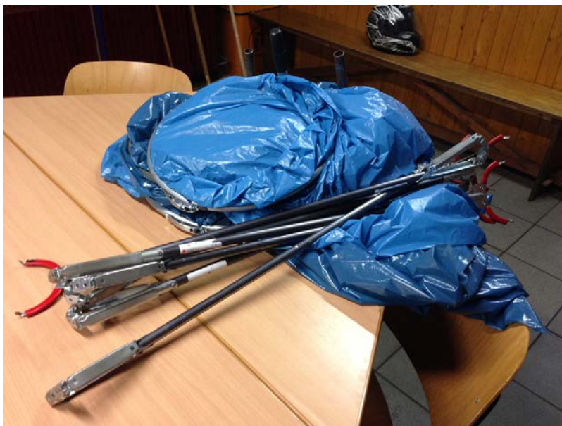
Figuur 1.7 Beheer van de openbare ruimte.

Het bewonersbedrijf is nog steeds in gesprek met de corporatie over een pilot schoonmaak. Zij voert nu wel (onbetaald) een pilot uit voor de gemeente op het gebied van groenonderhoud (beheer van de buurttuin). Het bewonersbedrijf zou na de zomervakantie van 2013 horen hoeveel geld er beschikbaar is, maar in november 2013 weet men het nog steeds niet. Het plan voor het wijkuitzendbureau ligt stil door het vertrek van een bestuurslid dat daar verantwoordelijk voor was. De zakelijk leider wil de focus verleggen naar re-integratietrajecten.