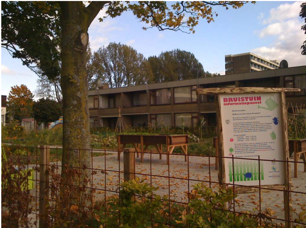
Figuur 1.3 De Bruistuin (Foto: Wenda Doff).

Alle huurders tekenen een contract waarin staat dat zij voor twee uur vrijwilligerswerk doen. Zo zullen de studenten begeleiding gaan bieden bij een nieuw project van het bewonersbedrijf, de Kinderwijkraad (geïnitieerd door oud LSA-medewerker). Bewoners kunnen voor een nog lagere huur tekenen als zij zich meer dan twee uur willen inzetten voor het Bruishuis. Zo zijn er een aantal huurders die zich fulltime inzetten voor het beheer en in ruil daarvoor geen huur betalen. Het blijkt in deze fase nog wel lastig om het aan de huurkorting gekoppelde vrijwilligerswerk te organiseren. Het moet immers allemaal beheerd worden.