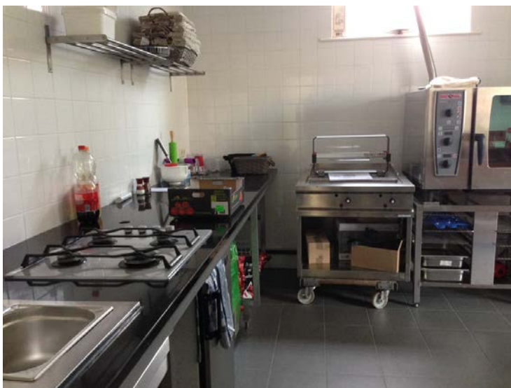
Figuur 1.6 De keuken van het BBHS

Voor het project catering is een keuken aangeschaft. In het eerste jaar is het BBHS logistiek partner in een warme-maaltijdservice en een broodjesservice. Beide activiteiten vinden geen doorgang in het tweede jaar. Voor het bezorgen van de warme maaltijden is het bewonersbedrijf nooit betaald, terwijl zij wel geïnvesteerd heeft in de aanschaf van scooters en het betalen van de vrijwilligers. De broodjesservice kwam niet van de grond. Ten tijde van het laatste interview is er wel een nagenoeg definitieve afspraak met een cateraar die de keuken zal gebruiken tegen een vergoeding en het bieden van werk voor vrijwilligers.