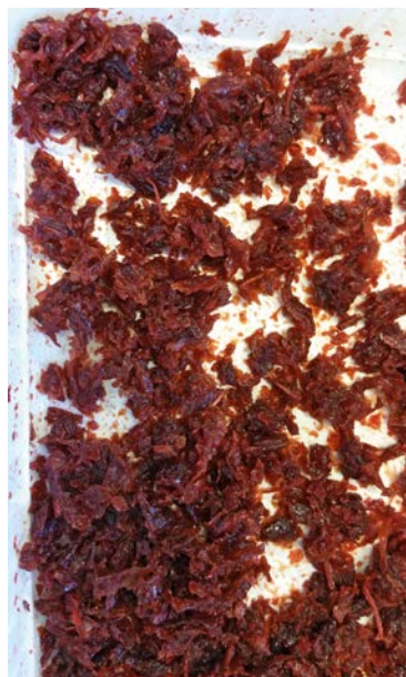
Molasse losgeroerd voor afroken

Recent heeft het Rijksinstituut voor Volksgezondheid en Milieu (RIVM) het risico op koolmonoxidevergiftiging door het gebruik van de waterpijp in kaart gebracht (RIVM 2016). Bij het roken van de waterpijp worden de molasses meestal door kooltjes (houtschool, natuurkool) verhit. Molasses kunnen ook elektrisch verhit worden. Bij het gebruik van kooltjes komen onder andere grote hoeveelheden van het giftige koolmonoxide (CO) vrij. Het RIVM adviseert om producten voor de waterpijp elektrisch te verhitten, zodat er geen CO vrijkomt van de verhittingsbron. Echter, blootstelling aan CO is niet het enige risico bij het roken van de waterpijp, ook bij elektrische verhitting komen er nog steeds stoffen vrij die tot schadelijke gezondheidseffecten kunnen leiden.