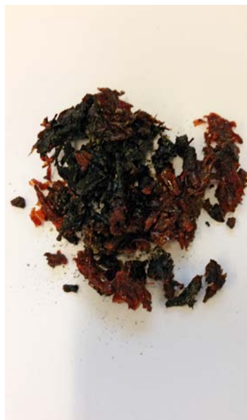
Molasse na afroken

De shishita is een waterpijp voor éénmalig gebruik en wordt geadverteerd als “super handig voor feestje, op vakantie, of mee naar een festival”(Grasscompany 2017). Een shishita bevat glycerol en verschillende smaken, zoals banaan, appel en kers. Ook voor de shishita geldt dat bij gebruik van kooltjes grote hoeveelheden CO en PAK’s vrijkomen. De precieze samenstelling die wordt ingeademd bij gebruik van stoomstenen via de waterpijp of de shishita is nog niet bekend. Wel is te verwachten dat gebruikers blootgesteld