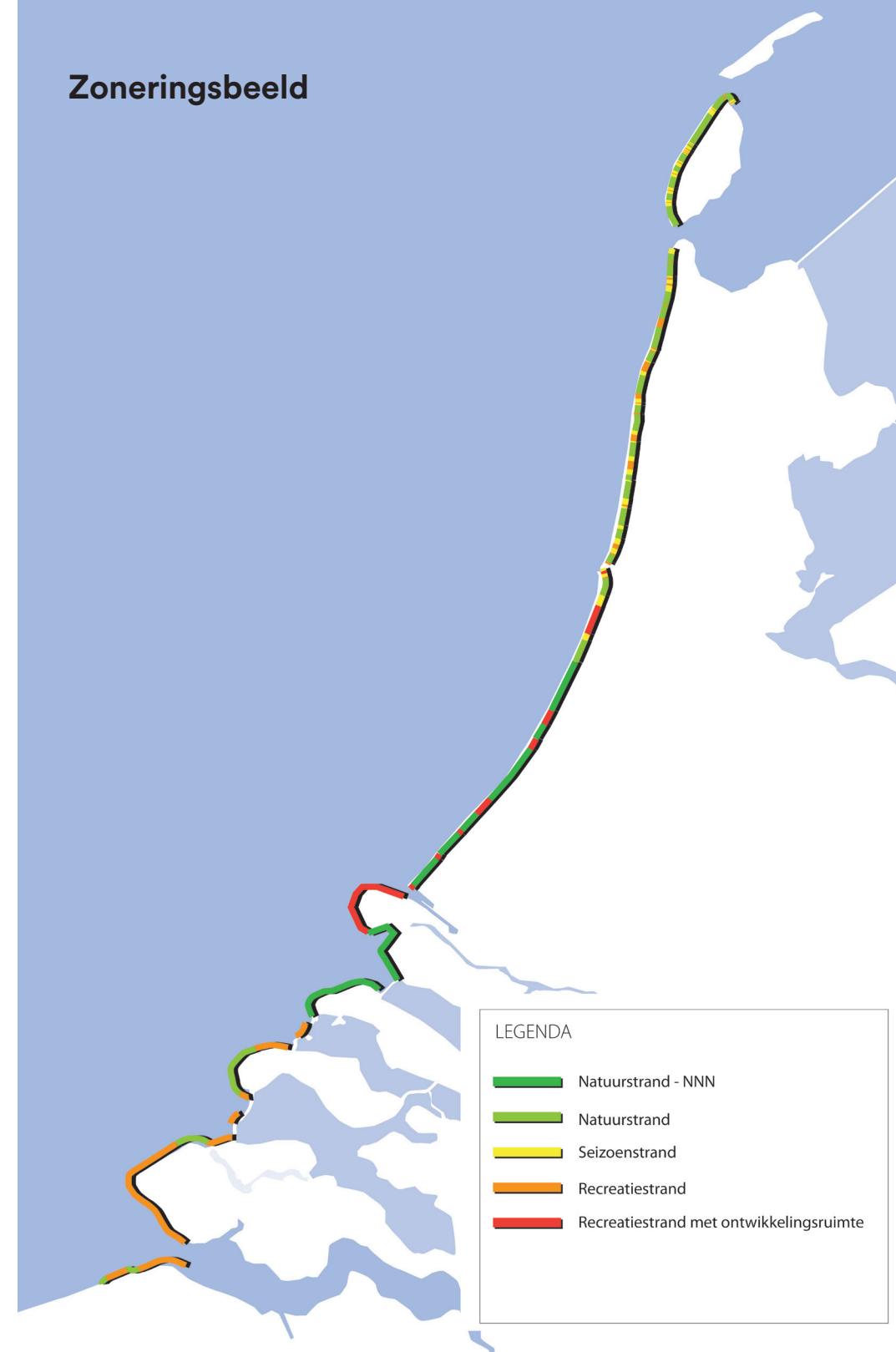
Figuur 1 Zoneringsbeeld