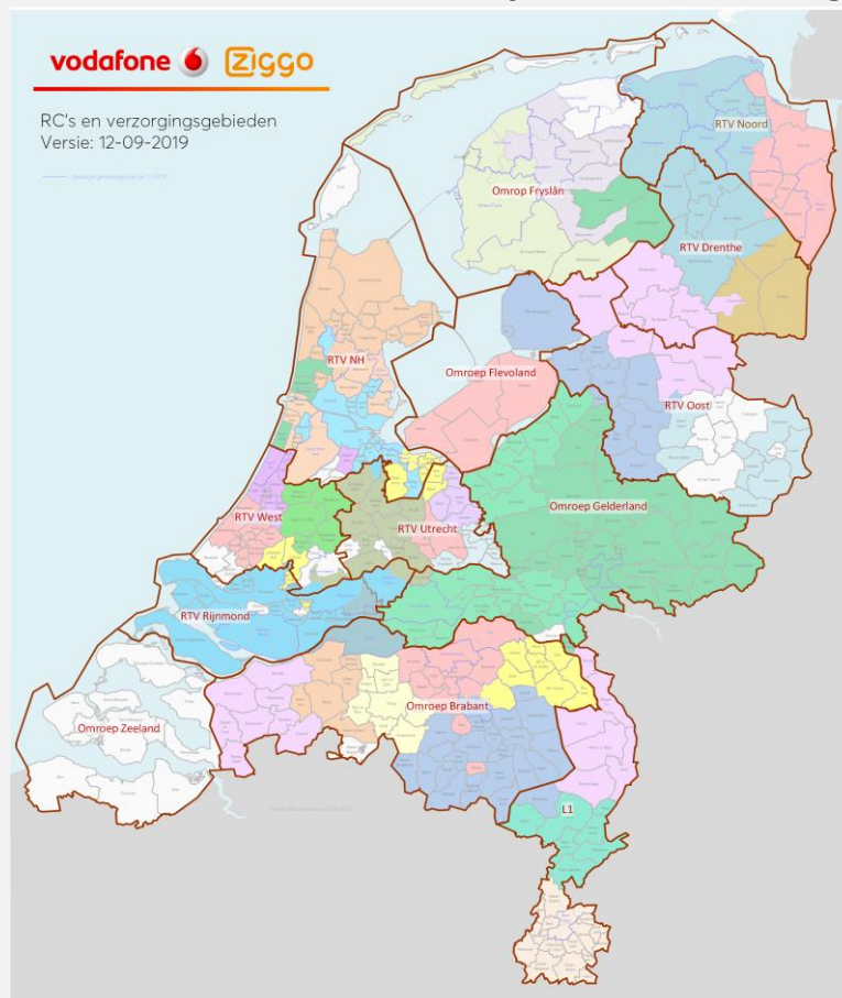
Figuur 3. Indeling van Nederland in regio's van VodafoneZiggo in 2019.

Toch is de fysieke inrichting van het netwerk niet willekeurig gekozen. Juist in de eerdergenoemde consolidatieslagen is er een fase geweest waarin netwerken op gemeentelijk en provinciaal niveau zijn samengevoegd. VodafoneZiggo heeft de segmentatie van haar netwerk aangeleverd, zie Figuur 3. Hieruit blijkt duidelijk dat voor veel dekkingengebieden van regionale omroepen best een aardige combinatie te maken is van netwerksegmenten. Voor Friesland kan VodafoneZiggo het lichtgroene gebied in het westen, het lichtpaarse gebied in het midden en het groene gebied in het oosten van Friesland gebruiken. Het witte gebied is van Kabel-Noord. Groningen werkt prima met blauw en roze. Tegelijkertijd zien we ook dat het voor sommige provincies minder goed werkt: Als het lichtblauwe segment in het Noorden het regionale venster van Groningen (RTV Noord) krijgt dan betekent het dat bijvoorbeeld Assen dit venster ook krijgt (en dus niet RTV Drenthe). Daarnaast zien we een aantal "fout" ingedeelde gemeenten, zoals Culemborg en Nederweert. Zederik en Leerdam waren incorrect ingedeeld, maar horen vanaf 1/1/2020 bij de provincie Utrecht. Overigens is op basis van deze afbeelding ook goed te zien waar andere kabelaars zitten. Deze zijn als witte vlakken aangegeven.