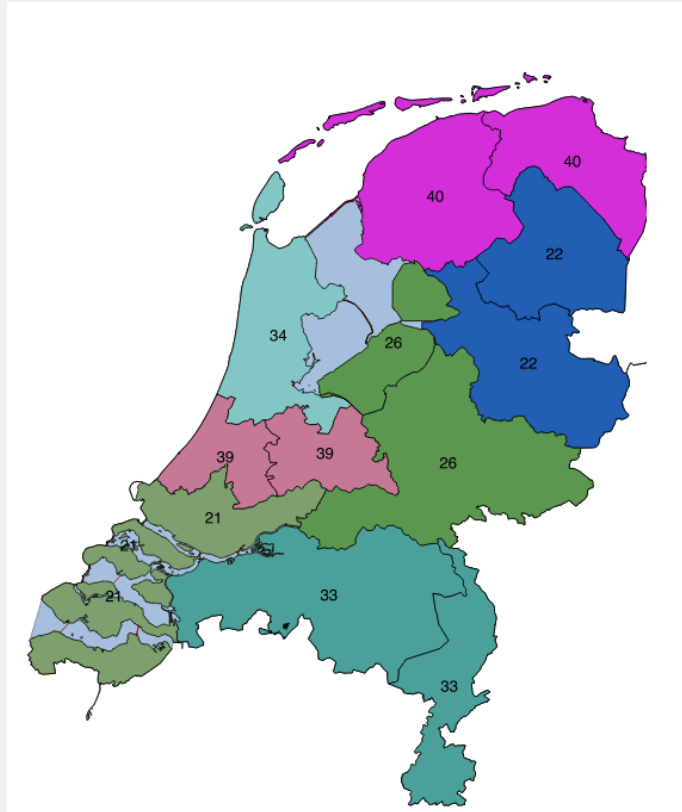
Figuur 4 Frequentiegebieden voor de NPO-multiplex via DVB-T2

De zenders van NPO worden bij DVB-T2 samen in één multiplex met de regionale omroepen uitgezonden. Dit gebeurt in Nederland op zeven verschillende frequenties. Iedere frequentie wordt ingezet voor een gebied dat in principe twee provincies bedekt, en bevat de regionale zenders voor deze twee provincies. 16 Figuur 4 toont de frequentiegebieden.