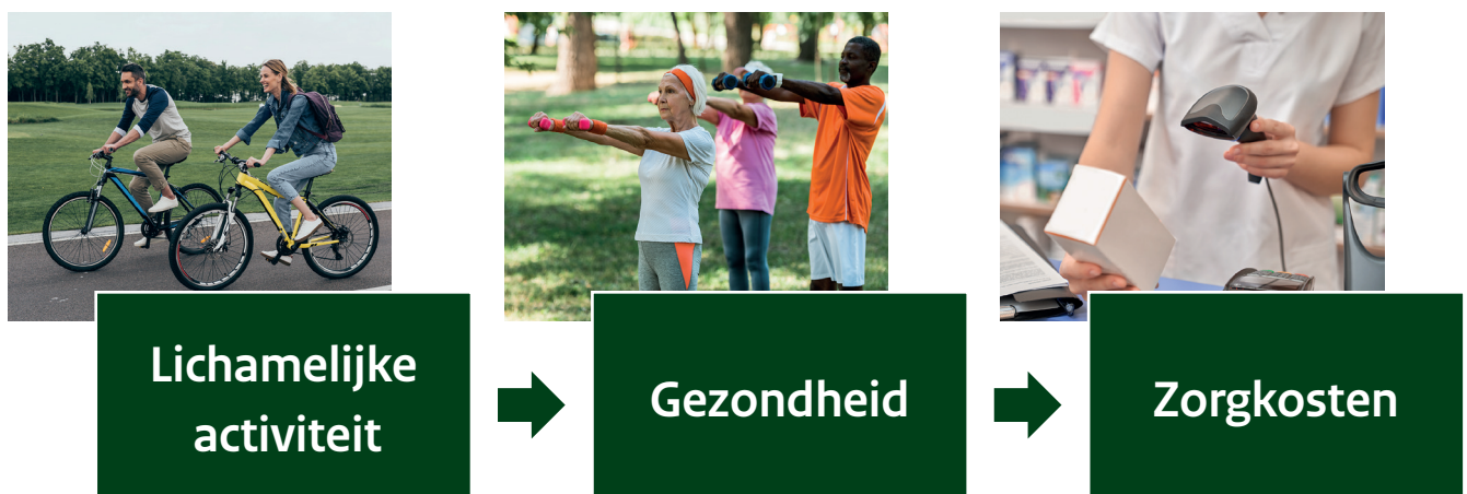
Figuur 2. Schematische weergave van de vraagstelling in het literatuuronderzoek.

is berekend. Deze publicatie beschrijft de maatschappelijke kosten en opbrengsten van lichamelijke activiteit 7 . Geschat wordt dat in Nederland elke Euro besteed aan lichamelijke activiteit een nut oplevert dat 2,51 Euro waard is 7 . Hierin zijn onder anderen kosten van voorzieningen en sportbenodigdheden opgenomen en opbrengsten door kwaliteit van leven, ziekteverzuim en arbeidsproductiviteit.