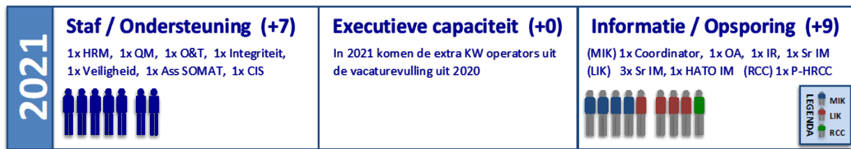
Figuur 1 Beoogde toename personeel in 2021

Bovenstaande staat uitgebeeld in figuur 1.