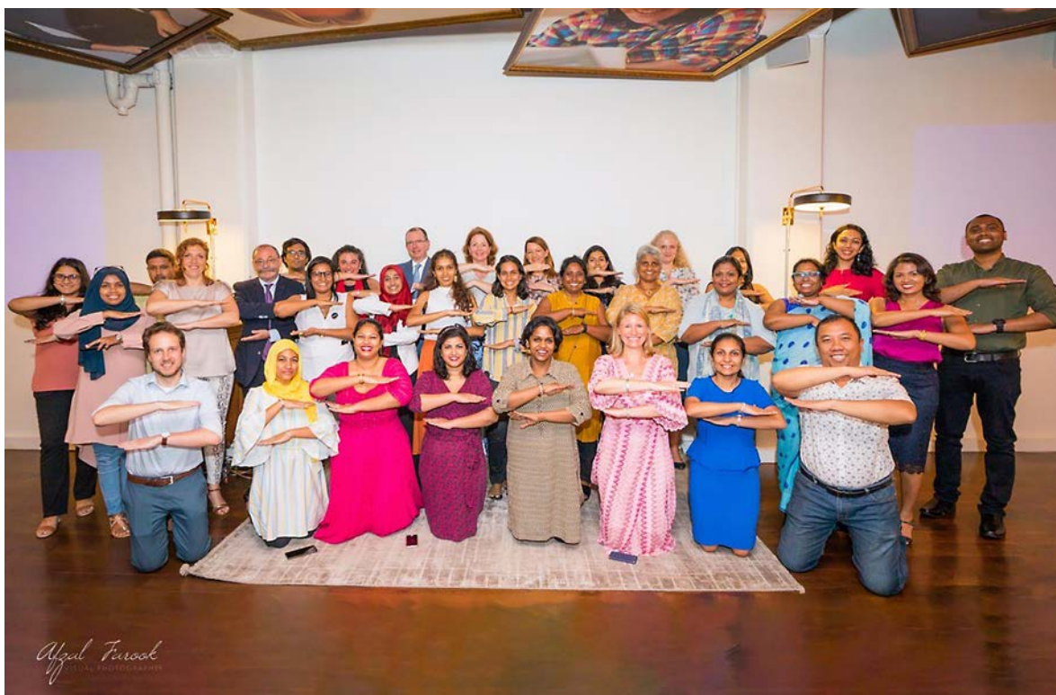
Tijdens Internationale Vrouwendag organiseerde de ambassade in Sri Lanka SPEAKUP! Talks, waarbij de kracht van storytelling centraal stond. Deelnemers konden hier in een veilige omgeving hun ervaringen uitwisselen en leerden over het doorbreken van taboes.

viering van 16 Days of Activism Against Gender-Based Violence . Een op de drie vrouwen in Zimbabwe krijgt te maken met seksueel of gender-gerelateerd geweld. In samenwerking met lokale organisaties werd de inzet geëerd van 16 vrouwen, mannen en instituties voor de bescherming van de rechten van vrouwen en meisjes in Zimbabwe. Zogenaamde 'gender kampioenen' werden gekozen uit meer dan 200 kandidaten uit het hele land. De ambassade toonde op sociale media 16 dagen lang het inspirerende werk van deze voorvechters van vrouwenrechten. Voorts steunde de ambassade ieder van de kampioenen met een beurs van USD 5.000 om hun belangrijke werk uit te breiden. Daarmee kunnen zij in samenwerking met lokale gemeenschappen de strijd verder aanbinden met gender-gerelateerd geweld, kindhuwelijken voorkomen, en de autonomie van vrouwen