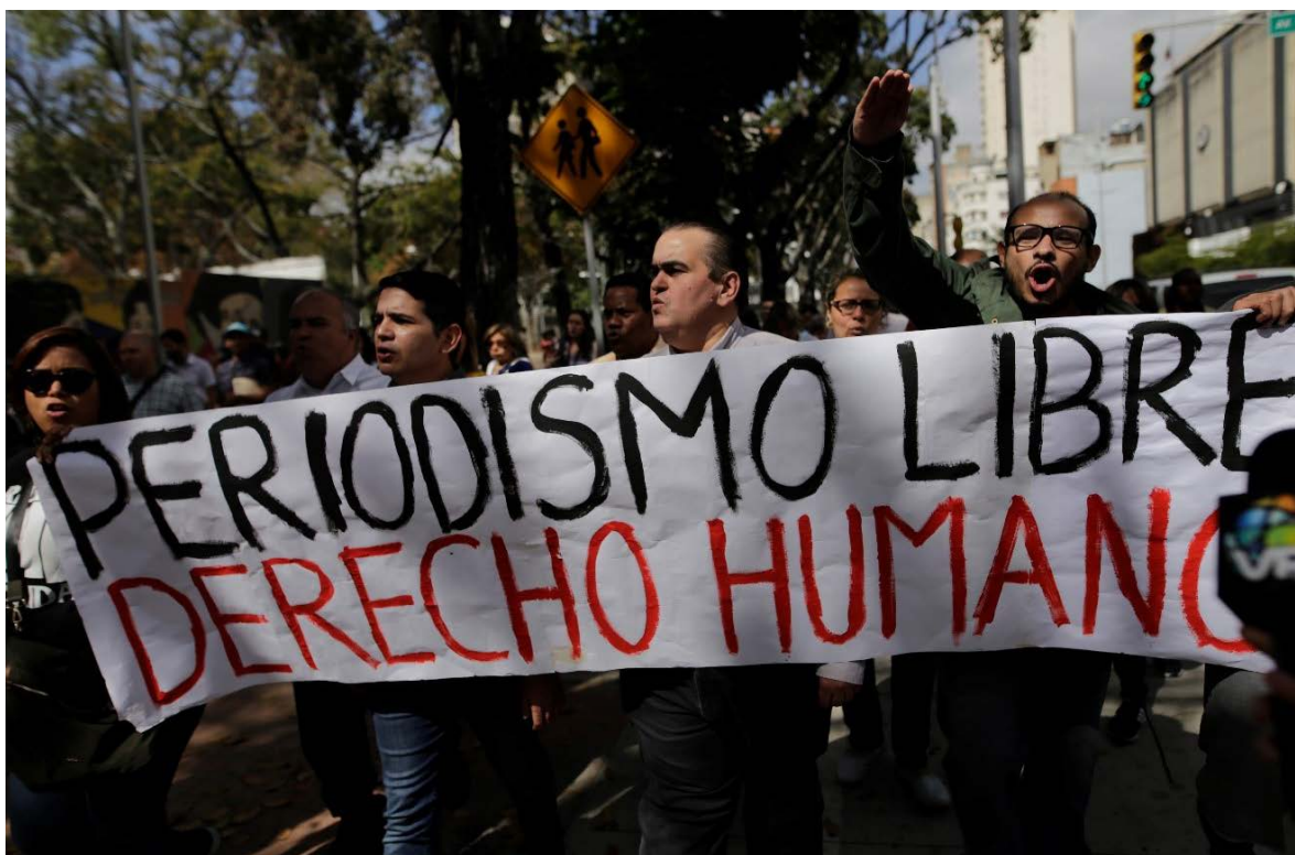
Manifestatie in Venezuela tegen aanvallen op journalisten door paramilitaire groepen in 2020.

Nederland werkte samen met FPU aan het creëren van een veilige omgeving waarin journalisten hun werk kunnen doen. Om te zorgen dat journalisten beschermd worden en hun werk kunnen voortzetten na geweld of intimidatie, heeft FPU het Reporters Respond noodfonds voor journalisten opgezet, met steun van Nederland. Via dit noodfonds zijn sinds de oprichting in 2011 in totaal 693 journalisten direct ondersteund. Helaas neemt de vraag alleen maar toe: in 2020 alleen al zijn 162 journalisten in nood geholpen. FPU steunde journalisten via het noodfonds met de betaling van reis- en kosten voor levensonderhoud, advies over digitale of fysieke veiligheid zoals een veilige VPN-verbinding, medische en psychologische hulp, en beschermingsmiddelen (vooral tegen COVID-19).