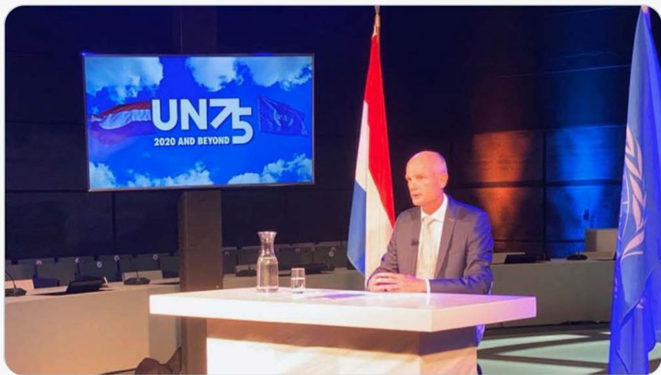
Minister Blok, vml. minister van Buitenlandse Zaken, bij het door Nederland georganiseerde evenement over Syrië tijdens de ministeriële week van de AVVN.

The horrific crimes of the Assad regime cannot go unpunished. Very glad with the support we got during the #UNGA event I just hosted. Discussed our step to hold Syria to account, national prosecution, the importance of evidence and a victim-centered approach.