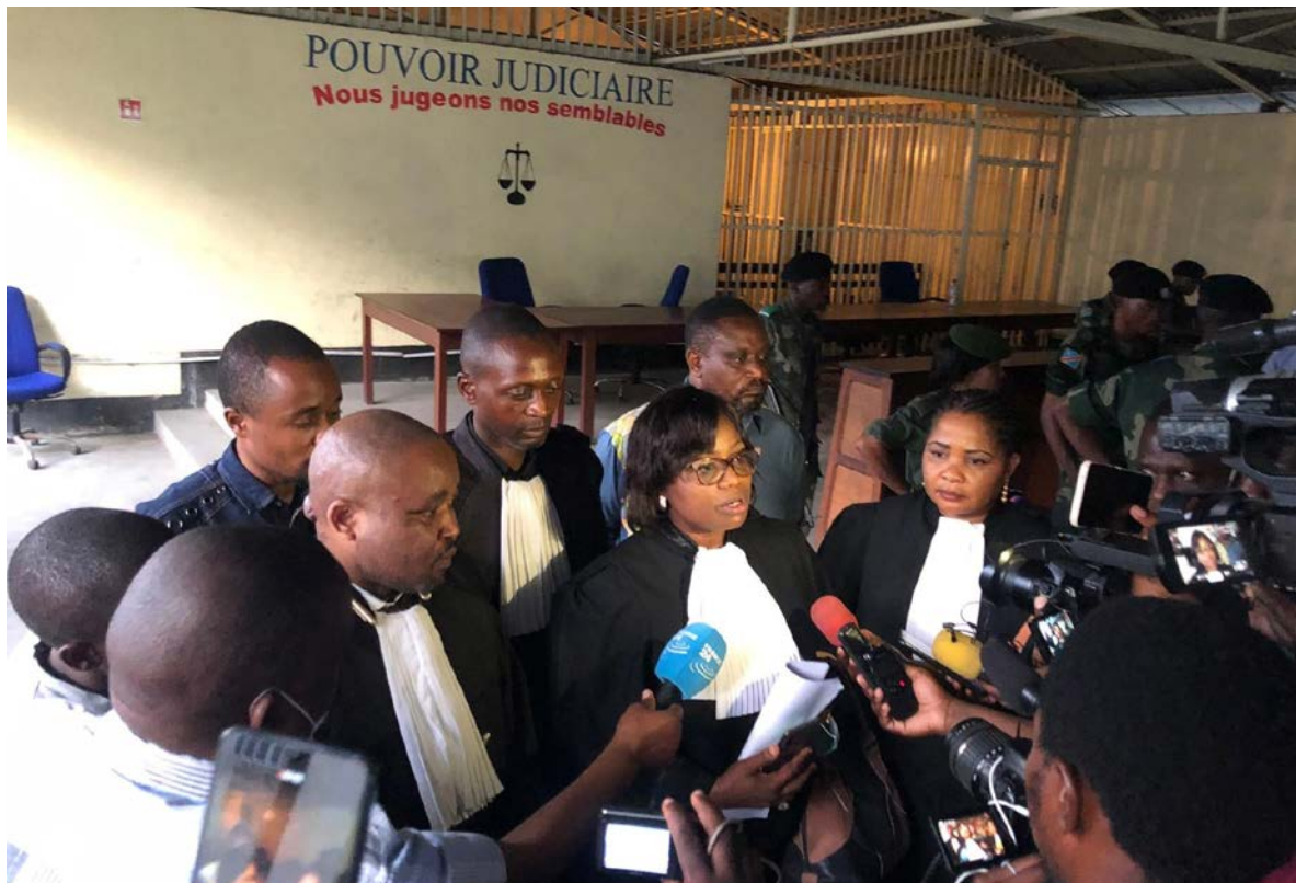
Via de organisatie TRIAL werden magistraten en advocaten getraind in de Democratische Republiek Congo.

Het Nederlands Forensisch Instituut bood in 2020, net als voorgaande jaren, op verzoek expertise aan ter ondersteuning van forensische onderzoeken wereldwijd. Dat kan gaan om verzoeken van het Internationaal Strafhof of andere hoven en tribunalen die forensisch bewijs vragen, maar ook van specialistische organisaties zoals de bewijzenbank voor Syrië.