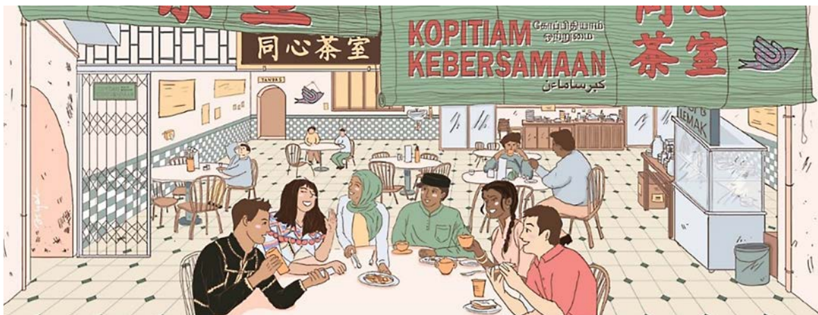
Campaign poster - Freedom of Religion or Belief and Expression Maleisië

In 2020 heeft de ambassade in Maleisië zich ingezet voor een progressievere discours over religieuze vrijheid onder jongeren. Nederland heeft op positieve wijze aandacht gegenereerd voor dit gevoelige onderwerp. Bewustwording van waarden zoals non-discriminatie, geweldloosheid, respect en het bevorderen van tolerantie tussen de verschillende etnische en religieuze groepen stond hierbij centraal. In samenwerking met verschillende organisaties, activisten en academici organiseerde de organisatie Komuniti Muslim Universal acht webinars waar sprekers met verschillende religieuze achtergronden werden samengebracht. Centraal tijdens deze webinars stonden verschillende onderwerpen gerelateerd aan religieuze vrijheid, geloof en expressie. In een van deze sessies werd specifiek aandacht besteed aan het recht om niet te geloven. Met de webinars werden in totaal meer dan 2000 personen bereikt. Een educatieve campagnevideo resulteerde tevens in een partnerschap met twee grote universiteiten in Maleisië. Zo wordt met de University Malaya een module opgezet voor academische doeleinden met focus op interculturele en interreligieuze educatie. In Tbilisi, Georgië, heeft Nederland bijgedragen aan de