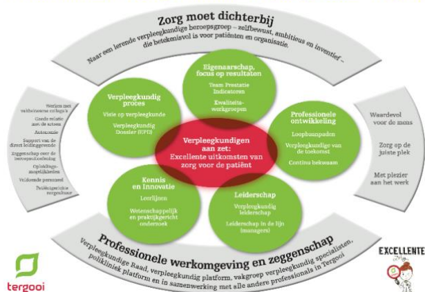
Professioneel Praktijk Model Verpleegkunde Tergooi

In Tergooi startten in 2016 de verpleegkundigen met een traject voor het verbeteren van de werkomgeving en professionele zeggenschap. Ter ondersteuning ontwikkelden zij het professionele praktijkmodel (figuur). Een nulmeting op basis van de pijlers Excellente zorg hielp de verpleegkundigen om te bepalen wat er nodig was om een sterke verpleegkundige organisatie neer te zetten. Een herhaalde meting in 2019 liet zien dat verbeteringen op alle Excellente zorg-pijlers zichtbaar was. Ook de komende jaren werkt Tergooi aan het versterken van de verpleegkundige organisatie en professionele zeggenschap, met elke drie jaar metingen zodat er inzicht is in de ontwikkelingen en waar nodig