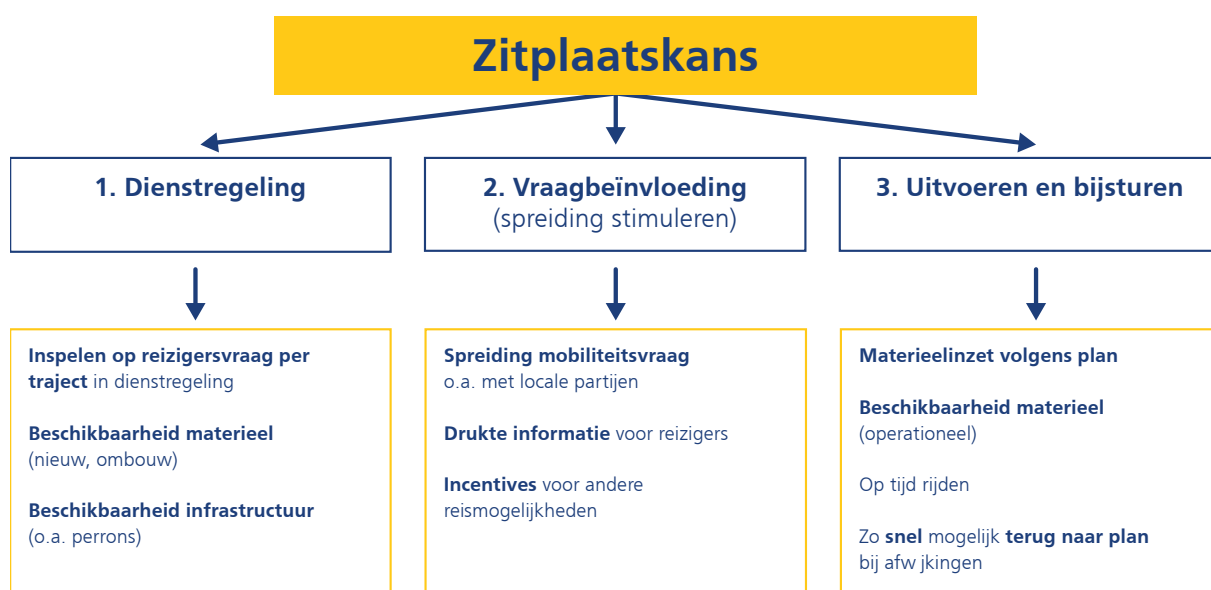
Figuur 2: drie terreinen waarop NS werkt aan zitplaatskans/drukke treinen

Sinds 2021 is er de nieuwe prestatie-indicator Aantal drukke treinen per werkweek in de spits HRN die zicht biedt op treinen boven de 'VOL-norm'. Tot en met februari 2020 ging dit om zo'n 100 treinen per werkweek. In coronatijd daalde dit aantal naar 0. NS neemt op drie terreinen maatregelen op het gebied van zitplaatskans/drukke treinen: