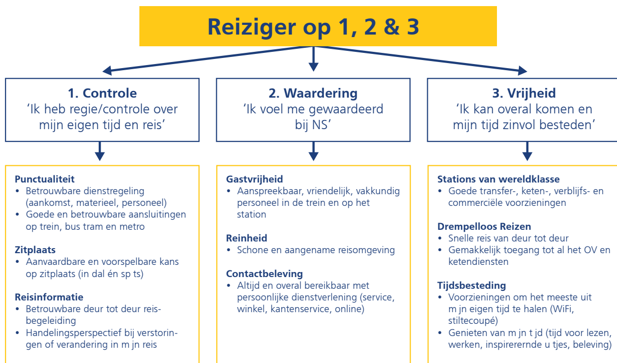
Figuur 1: Onze prestaties op bovenstaande negen thema's beïnvloeden gezamenlijk het algemeen klantoordeel.

We streven naar zowel het verbeteren van de prestaties op de satisfiers als het op peil houden van het prestatieniveau voor de dissatisfiers . Daarbij zijn keuzes nodig om het spoorvervoer van hoge kwaliteit te laten blijven voor onze reizigers en tegelijkertijd ook betaalbaar te houden. Op die manier werken we aan het realiseren van de doelstellingen op alle prestatie-indicatoren, waaronder het Algemeen klantoordeel. In de volgende paragrafen zetten we per thema uiteen wat de relatie is met de klanttevredenheid en wat we doen om de tevredenheid van onze reizigers op peil te houden.