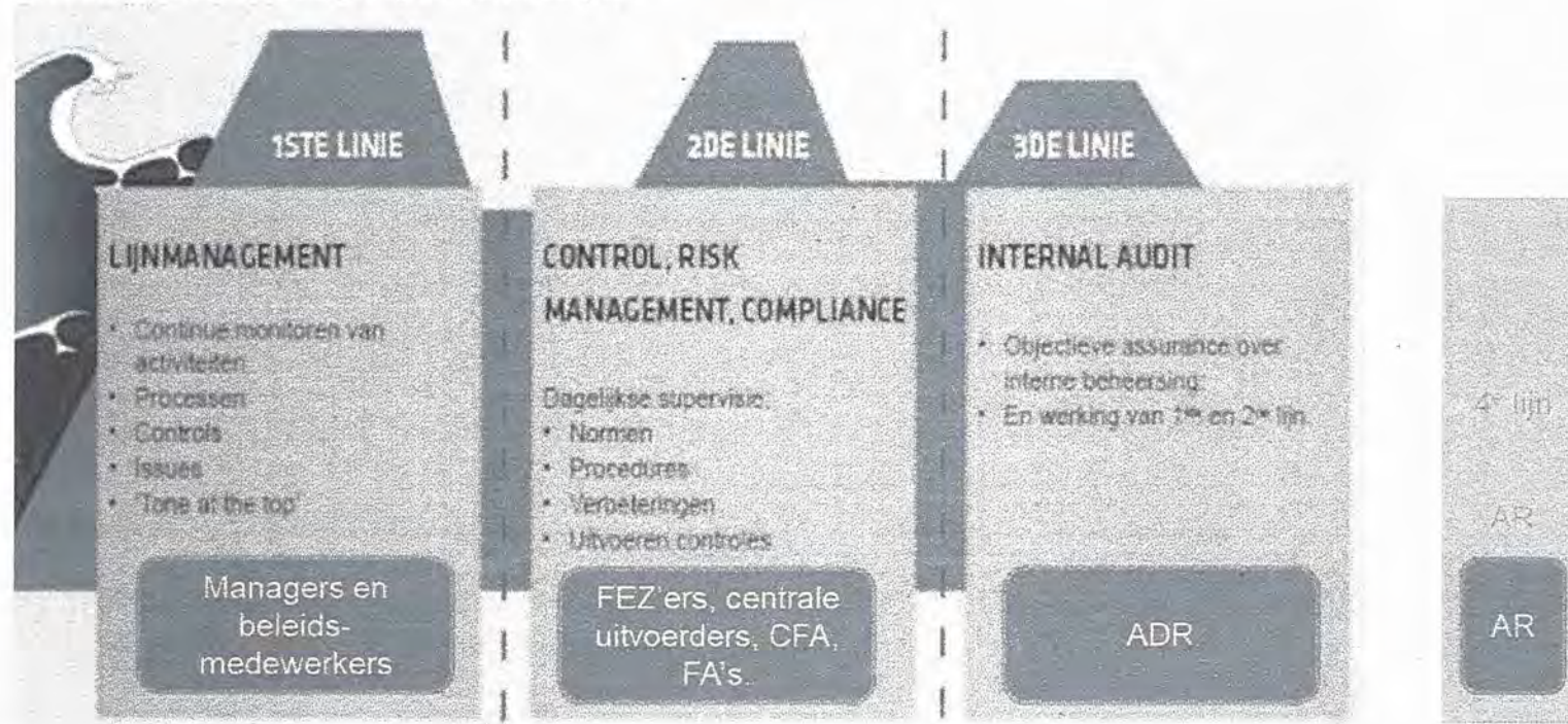
Drie liniemodel en doelgroepen veranderplan