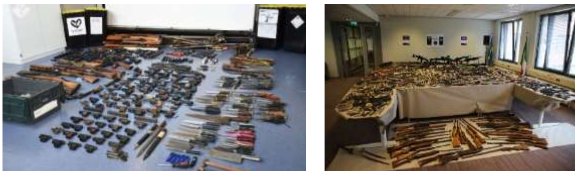
Resultaat van de lokale inleveracties in Amsterdam (links) en Den Haag

volgt met een eigen actie '#DropIt' in de periode van 17 tot en met 22 mei 2021, waarbij 669 (vuur)wapens ingeleverd zijn. 9 Deze lokale initiatieven vallen buiten het bestek van dit eindverslag.