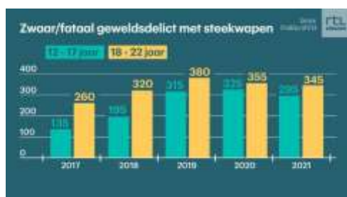
Tabel 2. Wapengebruik en inbeslagname van wapens bij jongeren

Sinds eind 2019 zijn bij herhaling dringende zorgen geuit over het wapengebruik onder jongeren. In 2019 zijn 315 jongeren van 12 tot 18 jaar en 380 jongvolwassenen van 18 tot 23 jaar betrokken bij een steekincident. Twee jaar later is dit aantal licht gedaald, maar nog steeds is sprake van een zorgwekkend verschijnsel. 2 De omvang van het wapenbezit onder jongeren zal een veelvoud zijn van het aantal gevallen van wapengebruik. Het aantal jongeren dat een wapen draagt, is onbekend. Indicatief is de Veiligheidsmonitor Voortgezet (Speciaal) Onderwijs, waarin 25% van de leidinggevendenden in 2018 wapenincidenten meldde (2016: 33%). Van de leerlingen in het VSO gaf 1% aan een wapen mee naar school te nemen en 9% zei dat buiten school te doen. 3 Daarnaast is de afgelopen jaren een aanzienlijk en toenemend aantal messen onder de jeugd in beslag genomen. 4