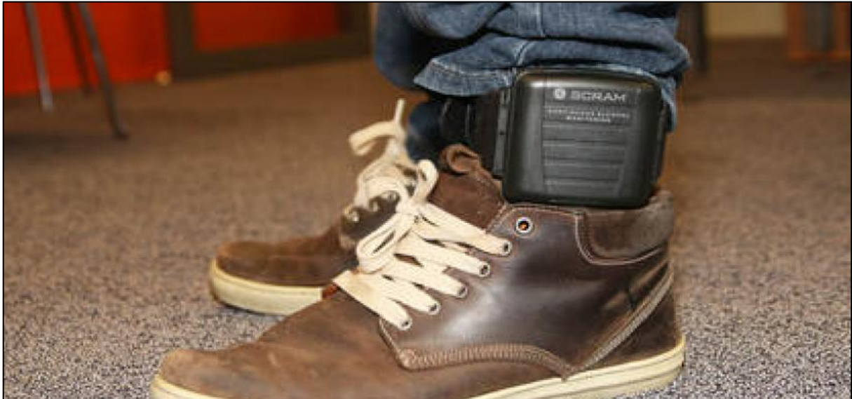
Afbeelding 1.1 Alcoholmeter

De voordelen van transdermale alcoholmetingen ten opzichte van bloed-, urine- of blaastesten zijn 4 :