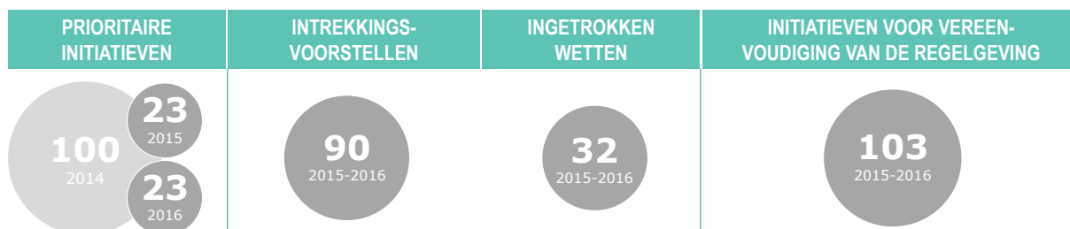
Grafiek 1. Betere regelgeving in cijfers voor 2015–2016

Tegelijkertijd is het aantal voorstellen van de Commissie aan het Europees Parlement en de Raad voor verordeningen en richtlijnen die volgens de gewone wetgevingsprocedure zouden moeten worden vastgesteld, gedaald van 159 in 2011 tot 48 in 2015. Het aantal richtlijnen en verordeningen dat het Parlement en de Raad sinds 2000 volgens de gewone wetgevingsprocedure hebben vastgesteld, varieert per jaar, met een piek van 141 in 2009. In 2015, het eerste jaar dat de Commissie-Juncker in functie was, was dat cijfer al gedaald tot 56.