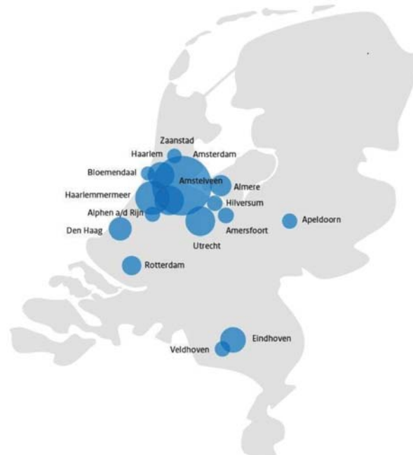
Figuur 3: Hoeveelheid reacties op basis van regio

Uit de reacties komt een gemengd beeld naar voren, van zowel uitgesproken voorstanders als uitgesproken tegenstanders van een vliegbelasting. De reacties duiden niet op een uitgesproken voorkeur voor een variant van een vliegbelasting die het kabinet zou moeten uitwerken.