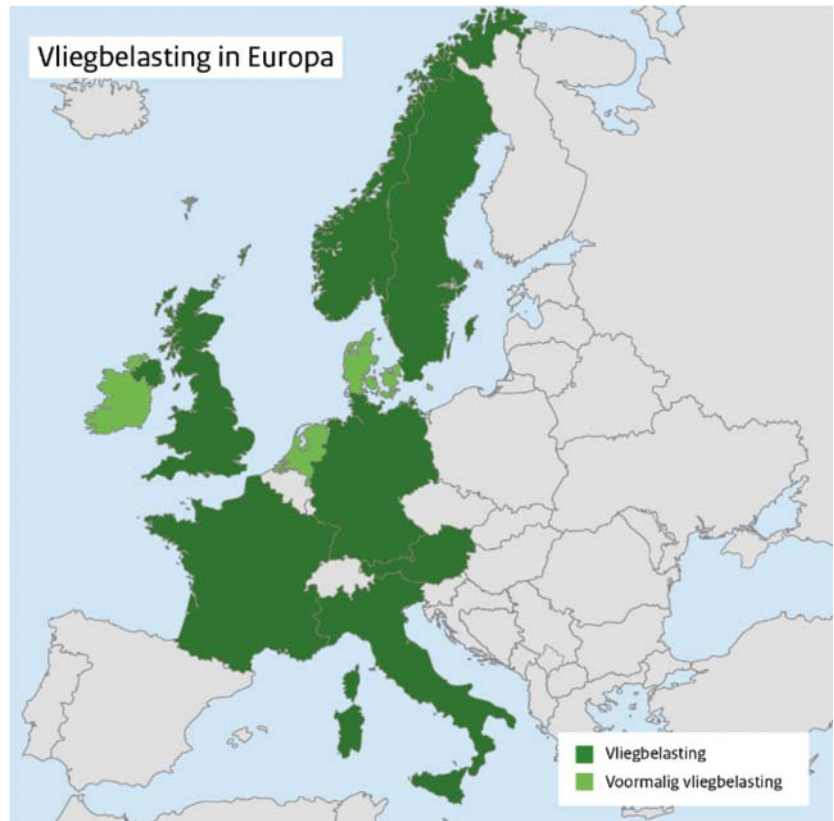
Figuur 2: Vliegbelasting in Europa

Bij de totstandkoming van dit wetsvoorstel heeft het kabinet kritisch gekeken naar de Nederlandse vliegbelasting die in 2008 in werking trad en in 2009 is afgeschaft. Bij die belasting betrof het tarief € 11,25 per ticket voor Europese vluchten en € 45 per ticket voor overige bestemmingen. Terugkijkend is het met name van belang dat de introductie en afschaffing van deze belasting samenvielen met de mondiale economische crisis. Bij de invoering werd een vermindering van de groei van het luchtverkeer verwacht. Door de crisis was er echter geen sprake van een afvlakking van de groei maar van een versterking van de krimp van het vliegverkeer, zoals die ook kon worden waargenomen op grotere luchthavens in de ons omringende landen. 3 Deze situatie leidde tot de beslissing de heffing van de vliegbelasting al na een jaar stop te zetten door het tarief te verlagen naar nul, gevolgd door afschaffing van de vliegbelasting per 1 januari 2010.