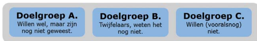
Figuur 1. Er zijn drie groepen te onderscheiden van mensen die nog niet gevaccineerd zijn.

De interventies die de GGD'en de afgelopen maanden hebben ingezet, zijn vooral gericht op doelgroep A: mensen die zich willen laten vaccineren, maar dat om wat voor reden dan ook nog niet hebben gedaan. Zij ervaren vaak fysieke barrières, die weggenomen kunnen worden door interventies als prikkenzonderafpraak.nl, de prikbus, de vrije inloop, pop-up locaties, etc. Daarmee zorgen de GGD'en ervoor dat het daadwerkelijk laten zetten van de prik zo makkelijk mogelijk wordt gemaakt. Maar ook wordt op doelgroep B ingezet met duidelijke informatie op meerdere manieren en met meerdere kanalen.