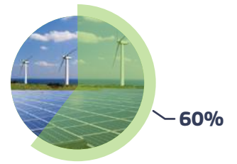
van de verbruikte hernieuwbare energie is bio-energie*