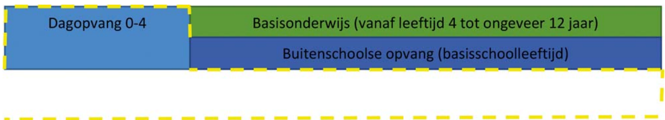
Figuur 1 Aansluiting kinderopvangstelsel en primair onderwijs

In het wetsvoorstel wordt de aansluiting tussen het kinderopvangstelsel en het primair onderwijs langs vier lijnen gecreëerd: de taal, het tweemaal jaarlijks overleg, een doorlopende lijn van voor- naar vroegschoolse educatie, en een goede overdracht tussen kinderopvang en de basisschool. In onderstaande alinea's worden deze lijnen nader toegelicht.