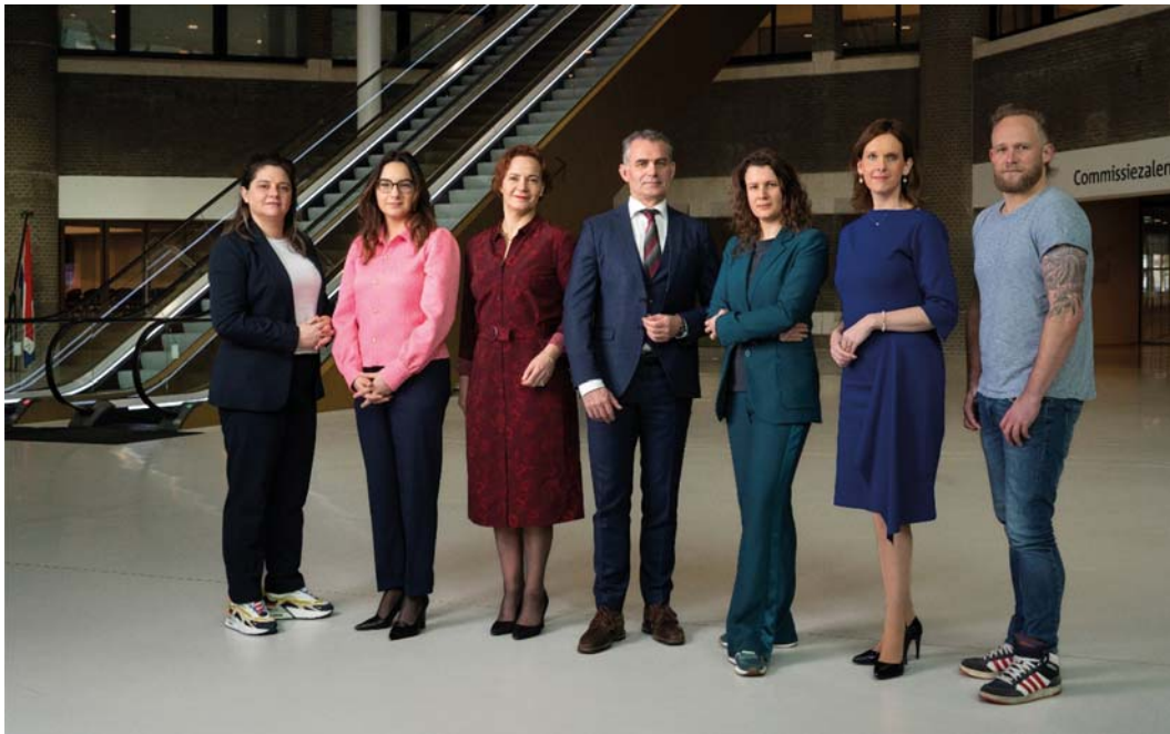
De leden van de parlementaire enquêtecommissie aardgaswinning Groningen. Van links naar rechts: Barbara Kathmann (PvdA), Hülya Kat (D66), Judith Tielen (VVD, ondervoorzitter), Tom van der Lee (GroenLinks, voorzitter), Anne Kuik (CDA), Stieneke van der Graaf (ChristenUnie) en Peter Kwint (SP).