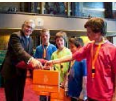
Aanbieding vernieuwde leskoffer Derde Kamer