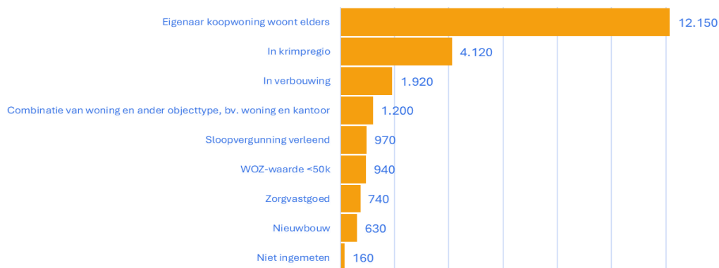
Figuur 3. Mogelijke verklaringen structurele leegstand na energiecorrectie, in aantallen woningen die aan één of meer verklarende kenmerken voldoen

Hiermee geef ik invulling aan de toezegging aan mevrouw Beckerman over een onderzoek naar verklarende kenmerken bij structureel leegstaande woningen voor het einde van 2024, gedaan tijdens het commissiedebat over ruimtelijke ordening van 2 oktober 2024 (TZ202410-049).