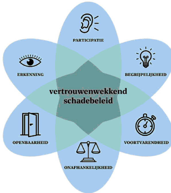
Figuur 1. Zes principes van vertrouwenwekkend schadebeleid. 51

Het herstellen van schade gaat bij vertrouwenwekkend schadebeleid niet om het repareren van een beperkt element, maar gaat – zeker in deze casus – om de basis van het overheidshandelen. Mensen hebben vertrouwensrelaties nodig omdat zij niet volledig zelfstandig kunnen handelen: vanaf de geboorte hebben we anderen nodig. We kunnen er niet zeker van zijn dat die anderen goedwillig jegens ons handelen, maar nemen een sprong in het diepe op basis van positieve verwachtingen over het gedrag en de intenties van de ander. 52 Als de overheid schade toebrengt en vertrouwensrelaties beschadigt, is er dus echt iets aan de hand. Het gaat weliswaar om het herstel van schade, maar dat is meer dan het bij elkaar vegen en aan elkaar lijmen van scherven; het gaat om het vertrouwen dat de overheid weet wat zij doet, dat zij haar positie goed gebruikt – en niet misbruikt – en dat er niet opnieuw scherven worden gemaakt. Het gaat dus om het gevoel van burgers of ze de overheid met al haar macht en kracht hun breekbare, kwetsbare en soms intieme details toevertrouwen. Burgers zijn afhankelijk van hun overheid, en burgers