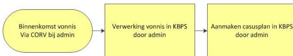
Afbeelding 2.1: Procesplaat binnenkomst vonnis