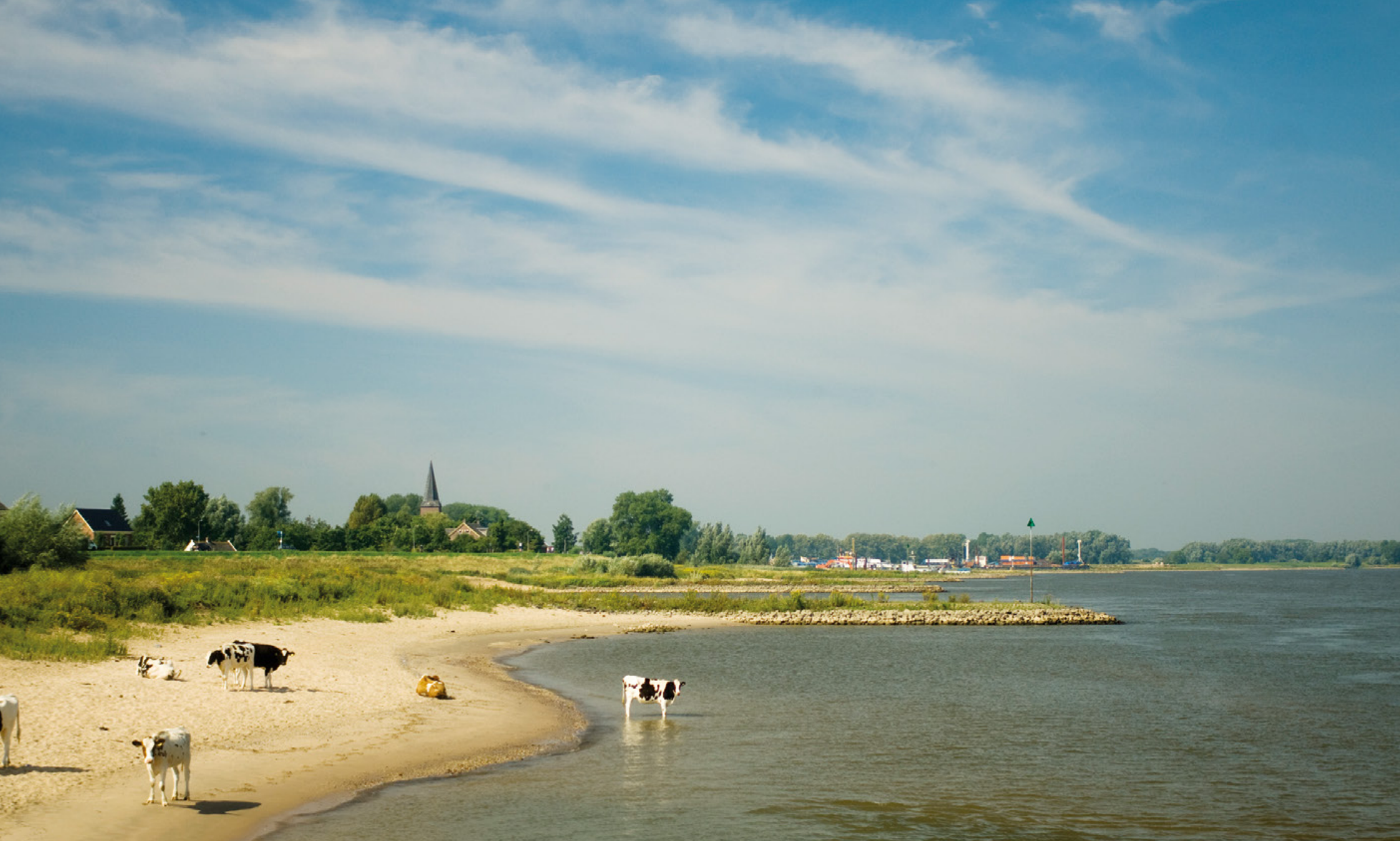
Breemwaard bij Zaltbommel, eerste fase; oude situatie met koeien bij de rivier