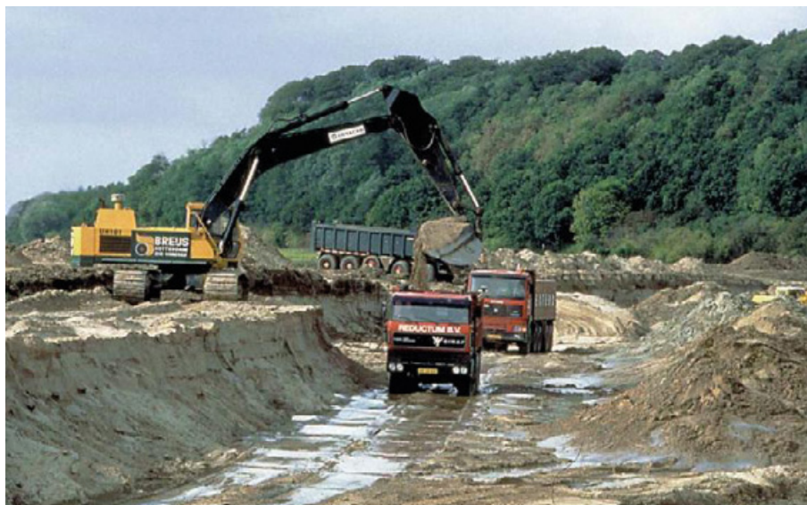
Grondverzet Blauwe Kamer

De twee uitvoerende diensten van de ministeries nemen de uitvoering ter hand: Dienst Landelijk Gebied en Rijkswaterstaat. Na de opheffing van Dienst Landelijk Gebied in 2015 neemt Staatsbosbeheer de taak over. De nieuwe riviergebonden natuur is voor het eerst te zien in de Blauwe Kamer (Nederrijn) en de Duursche Waarden (IJssel).