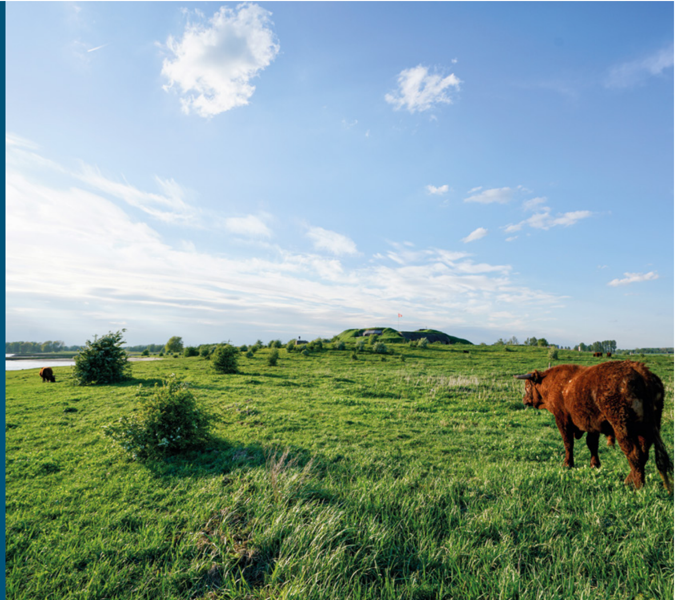
Uiterwaarden bij Fort Pannerden met begrazing door rode Geuzen

In de Klompewaard leeft sinds enkele jaren de weidesprinkhaan. Deze sprinkhaan is waarschijnlijk in 1946 uitgestorven in Nederland, maar is nu teruggekeerd op de zandige oeverwallen en de verdedigingswallen van het magistrale fort Pannerden bij de Klompewaard. Vanuit dit gebied verspreidt de soort zich verder naar uiterwaarden aan de overkant van de Waal. Het is een van de successen van dit kleine gebied op de splitsing van de Waal en het Pannerdensch Kanaal. Ook andere pioniersoorten die heel lang zeldzaam waren, doen het hier weer goed, zoals slijkgroen en klein vlooienkruid. Polei, een muntachtige die bijna niet meer voorkomt in Nederland, is hier massaal aanwezig. Het konijn is inmiddels op de Rode Lijst beland, maar heeft hier een gezonde populatie. Al deze soorten profiteren van begrazing door paarden en runderen.