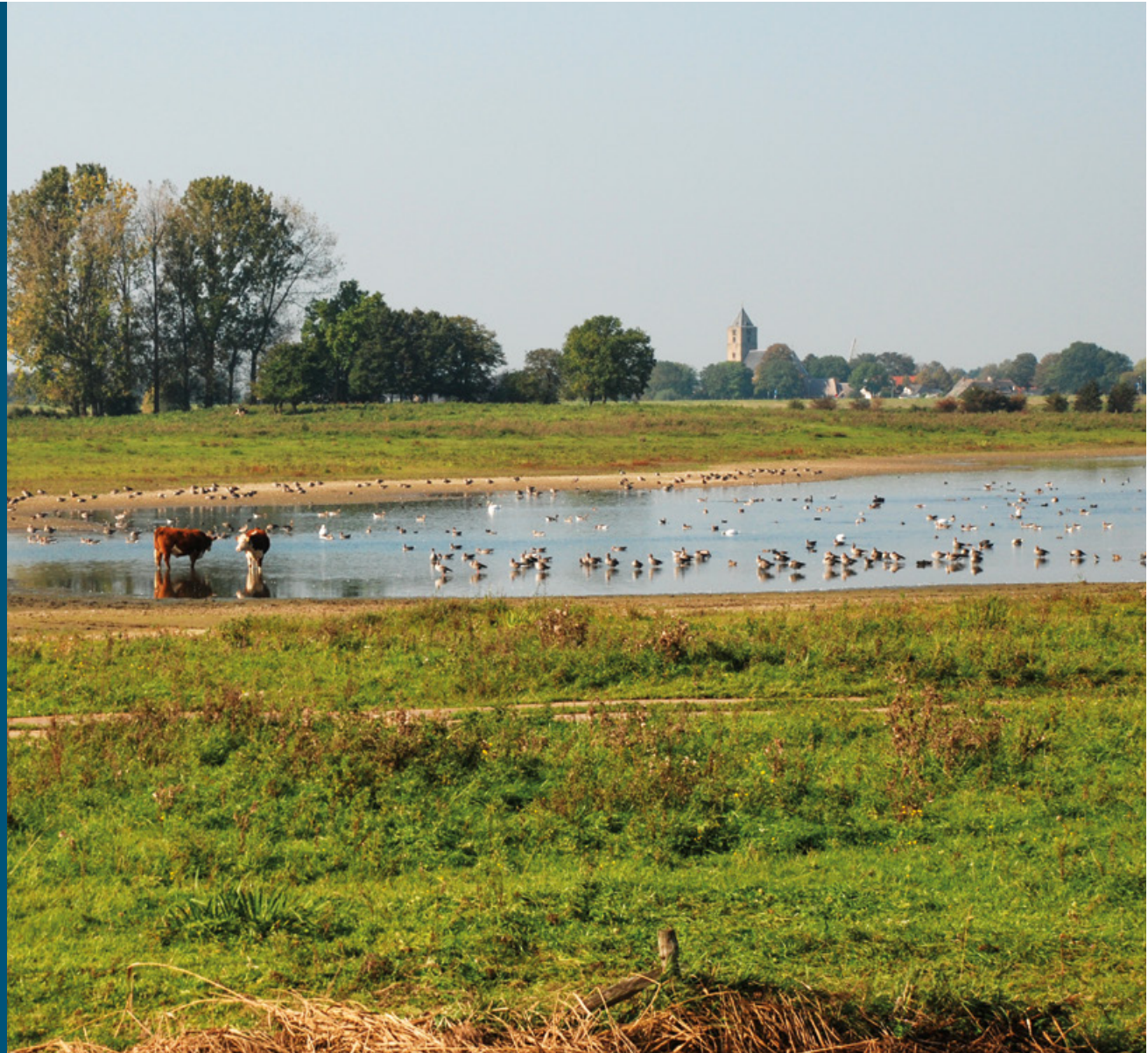
Vreugderijkerwaard met Zalk op de achtergrond | Cobie Uiterwijk

Na de hoogwaters van 1993 en 1995 besloot een boer zijn land in de Vreugderijkerwaard te verkopen en elders een nieuw bedrijf te beginnen. Dat luidde een snelle verandering in: een paar jaar later ging de herinrichting van start. Er kwam een meestromende nevengeul met flauwe oevers, er ontstond moeras en een (niet gepland) ooibos. In het begin - het pionierstadium - broedden er kluten op de zandige oevers. Nu de natuurlijke successie verder is gevorderd, is het een eldorado voor steltlopers die hier tijdens de trek foerageren en uitrusten: grutto's, watersnippen, kemphanen en verschillende soorten ruiters. Tussen de nevengeul en de IJssel ligt een fraaie oeverwal met glanshaverhooiland, begraasd door runderen. De grond die vrijkwam bij de herinrichting bleek tegen de verwachting in niet geschikt voor dijkversterkingen: er zat te veel zand in. Toevallig speelde op dat moment ook de natuurontwikkeling in het Ketelmeer. De aannemer heeft de grond uit de Vreugderijkerwaard benut om daar eilanden aan te leggen. Daar broedt nu een zeearend die af en toe in de Vreugderijkerwaard komt foerageren.