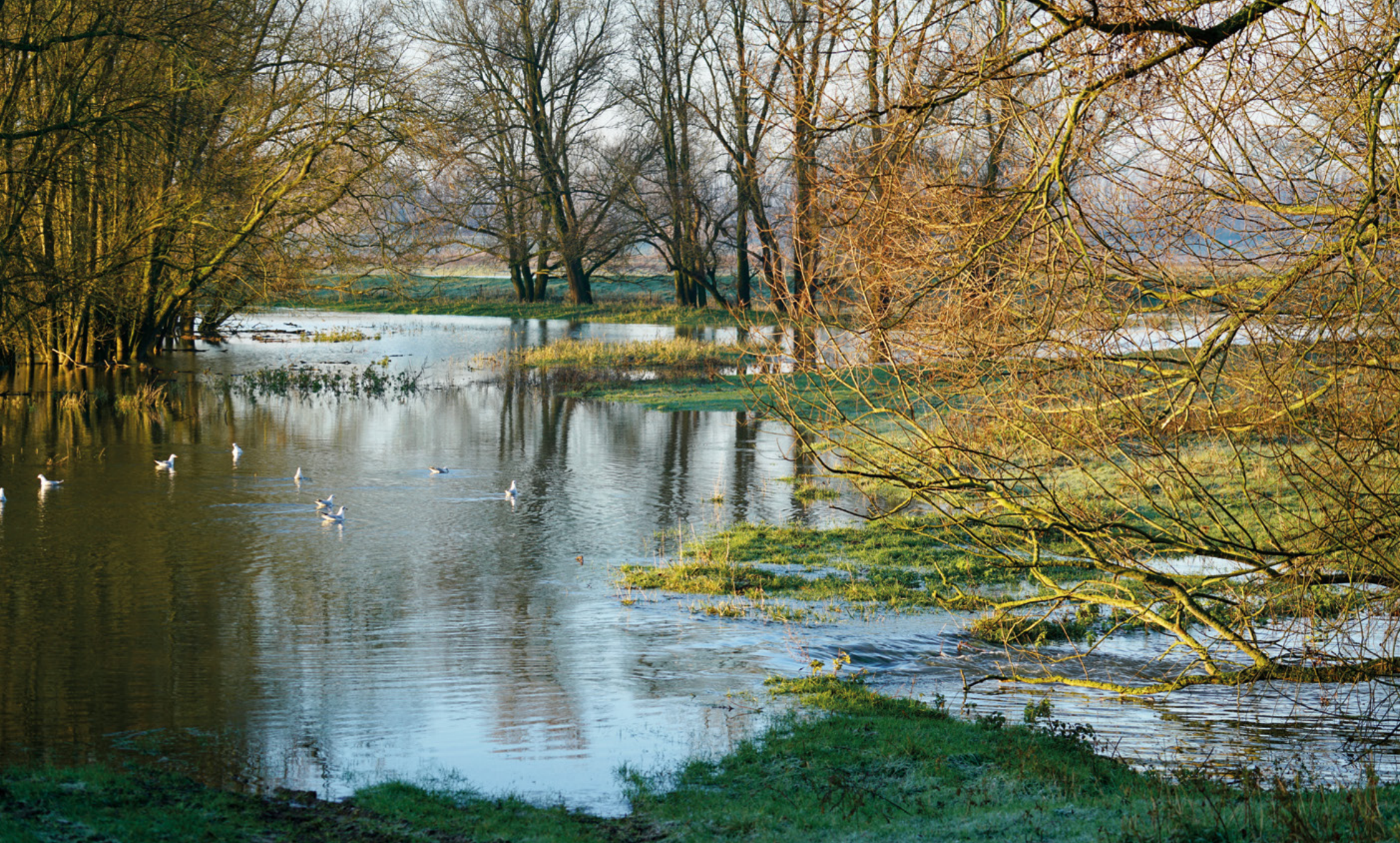
Hoogwater in oobos