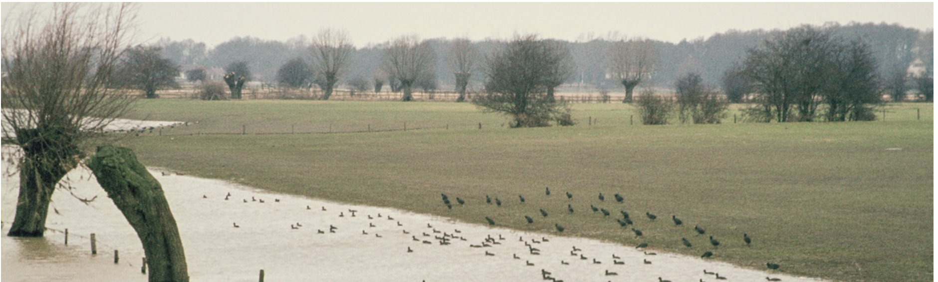
Rivierdijken: hoogwater in de IJssel, kwel binnendijks

Werk aan het rivierengebied is nooit af. Het programma Integraal Riviermanagement verbindt verschillende opgaven op het gebied van waterveiligheid, bevaarbaarheid, zoetwaterbeschikbaarheid, waterkwaliteit, natuur en een (economisch) aantrekkelijke leefomgeving. De transities in de landbouw (natuurinclusieve landbouw, circulaire landbouw) en de stikstofaanpak (Programma Natuur van het ministerie van LNV) kunnen nieuwe kansen voor synergie brengen. Zo wordt het rivierengebied nóg mooier en natuurlijker.