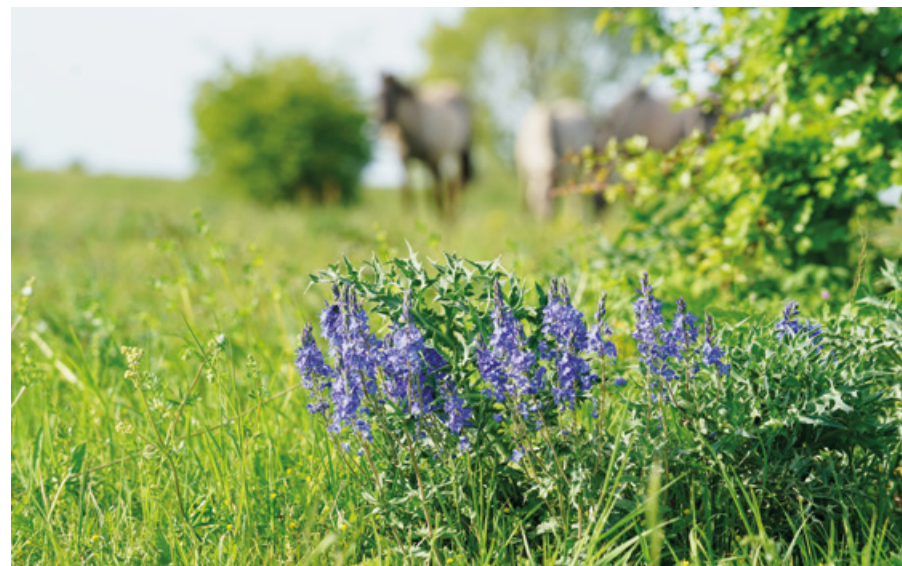
Erlecomse Waard: brede ereprijs en grazende konikpaarden

Een centrale rol is weggelegd voor het programma Integraal Riviermanagement. Dit programma verbindt verschillende opgaven op het gebied van waterveiligheid, bevaarbaarheid, zoetwaterbeschikbaarheid, waterkwaliteit, natuur en een (economisch) aantrekkelijke leefomgeving. Bekende combinaties - met dijkversterkingen, rivierverruiming en verantwoorde delfstoffenwinning - blijven goede kansen bieden. De transities in de landbouw (natuurinclusieve landbouw, circulaire landbouw) en de stikstofaanpak (Programma Natuur van het ministerie van LNV) kunnen nieuwe kansen voor synergie brengen.