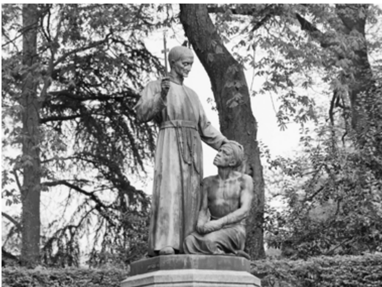
Standbeeld Peerke Donders in Tilburg

Peerke Donders (1809-1887) was een missionaris in Suriname tijdens en vlak na de slavernij. Donders is ook bekend als de 'Apostel der Melaatsen en Indianen' omdat hij zich in Suriname als een van de weinigen ontfermde over de melaatsen, en daarmee een groot risico nam voor zijn eigen gezondheid. Zijn handelen was ingegeven door zijn overtuiging van radicale gelijkwaardigheid. In Suriname wordt hij tot op de dag van vandaag geëerd vanwege zijn onzelfzuchtige inzet. In 1982 werd hij door Paus Johannes Paulus II zalig verklaard.