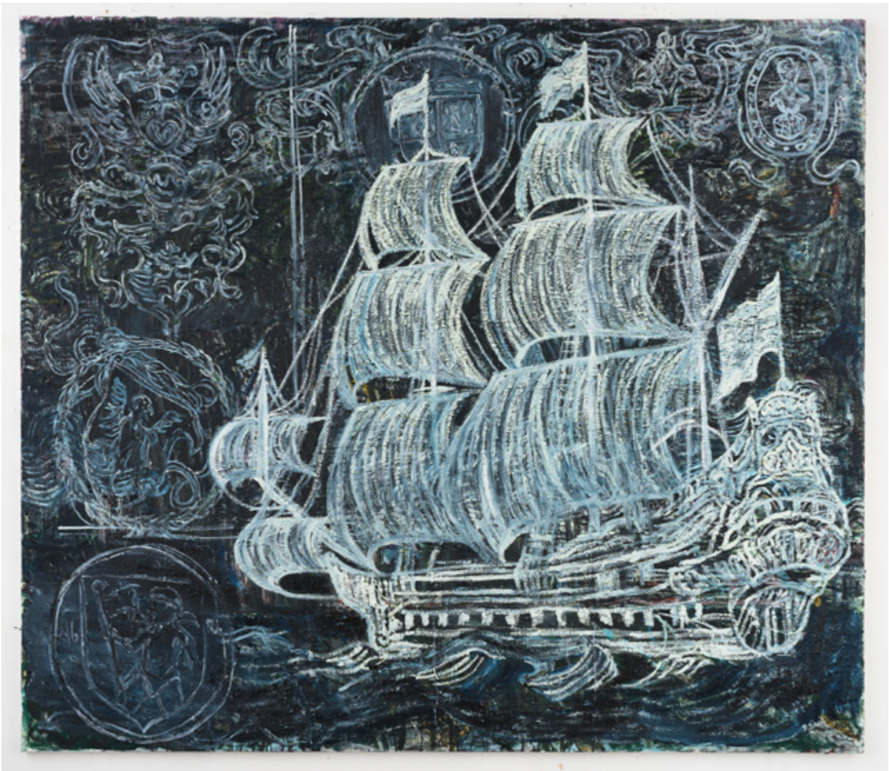
Natasja Kensmil | White Elephant, 2019 | Collectie Amsterdam Museum

Neem om het onderwijs te versterken maatregelen om ervoor te zorgen dat de onderwerpen slavernijverleden en de doorwerking daarvan in het heden een vast onderdeel worden van het curriculum in alle onderwijsniveaus en vooral ook in de pedagogische opleidingen.