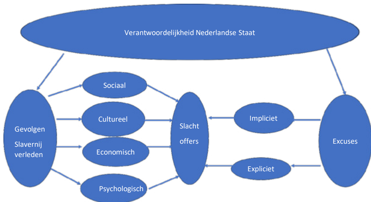
Figure 1: Gevolgde methode

Voor het bepalen van een visie in deze vanuit een wetenschappelijke context zal de volgende gedachtegang gevolgd worden. Allereerst zal kort uiteen gezet worden wat de gevolgen van het slavernijverleden waren op sociaal, economisch en cultureel gebied voorde gemeenschappen van de Nederlandse Caribische eilanden. Daarna zal toegelicht worden wat de betekenis van excuses aanbieden is en wat de impact kan zijn op slachtoffers, de Nederlandse staat en andere belanghebbenden. De vraag zal ook beantwoord moeten worden in hoeverre de Nederlandse Staat hiervoor verantwoordelijk was of niet. Tot slot zal gekeken worden naar vormen van excuses. Indien deze aangeboden worden, zal dit leiden tot een betere verstandhouding tussen de gemeenschappen in het Caribisch gebied en de Nederlandse Staat. De gevolgde methodiek wordt hieronder grafisch weergegeven.